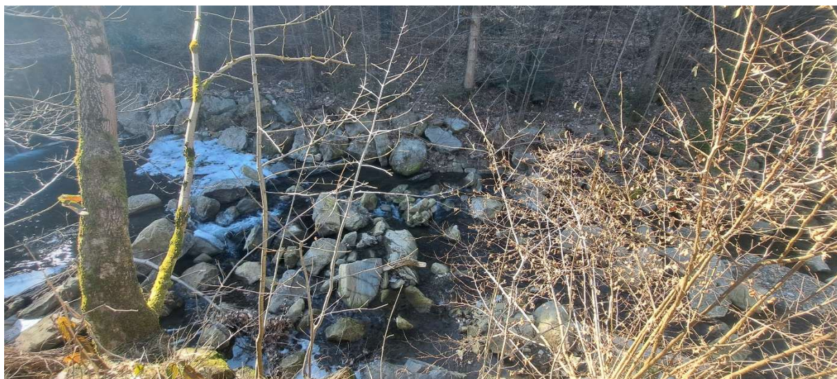
7. SO 02.1 – koryto pod vývarem