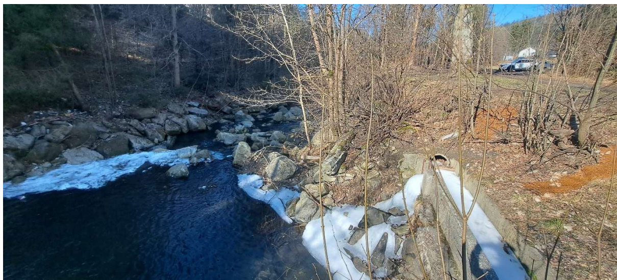
6. SO 02.1 – pravý břeh – chybějící opevnění