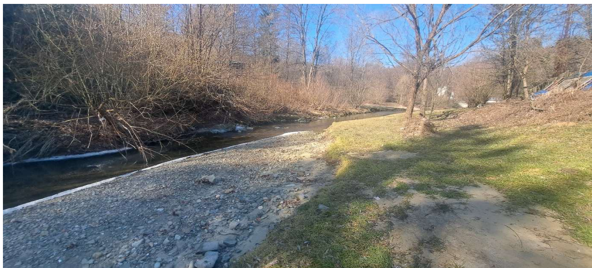
4. SO 01 – Bystříčka – pravý břeh – konec úseku