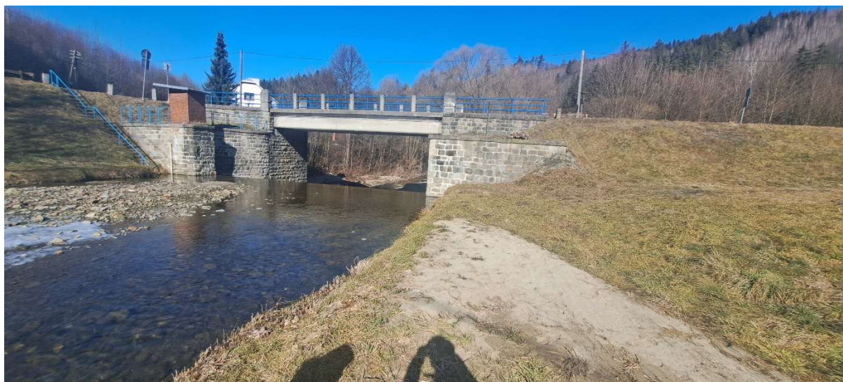
2. SO 01 – prostor lapače – pravý břeh