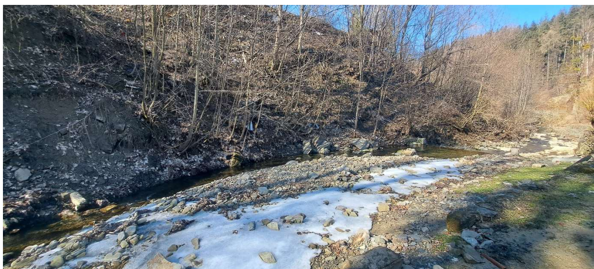
10. SO 02.2 – levý břeh – sanovaná nátrž + stupeň na začátku úseku