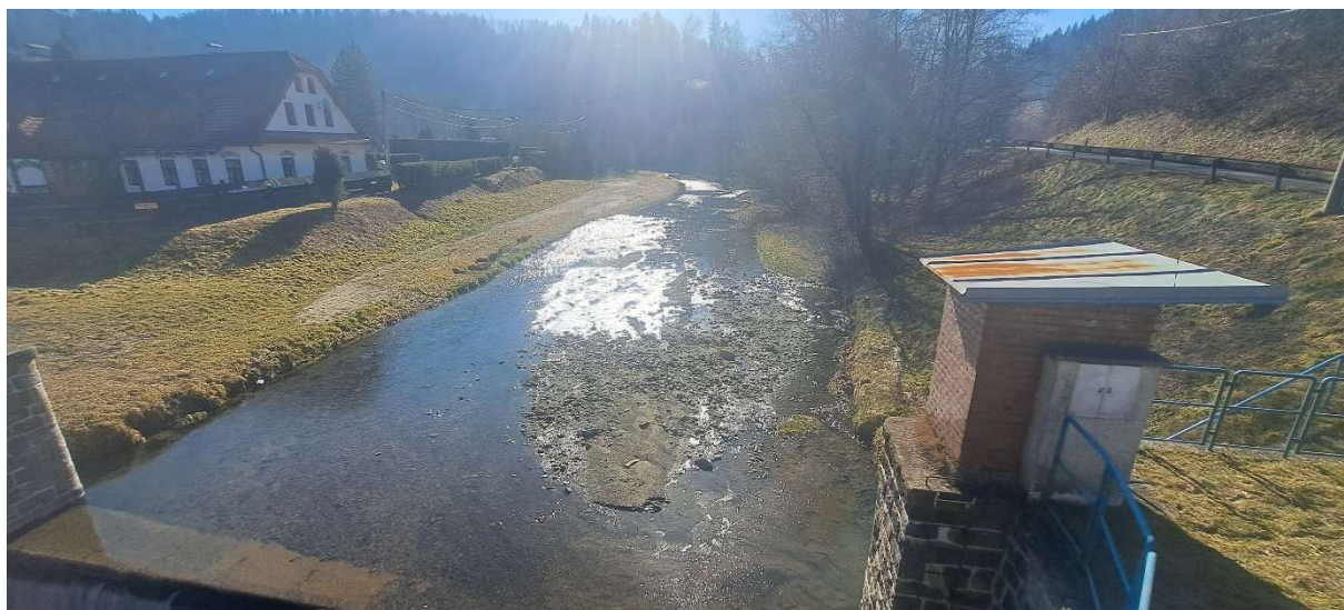
1. SO 01 – prostor lapače – pohled z mostu