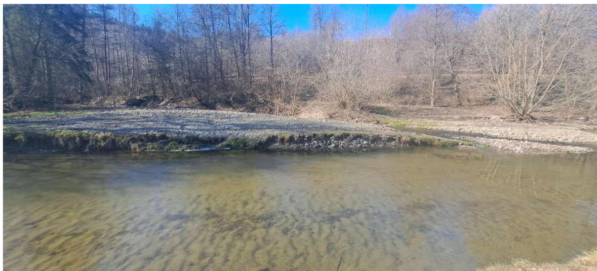
3. SO 01 – prostor lapače – soutok s Malou Bystříčkou