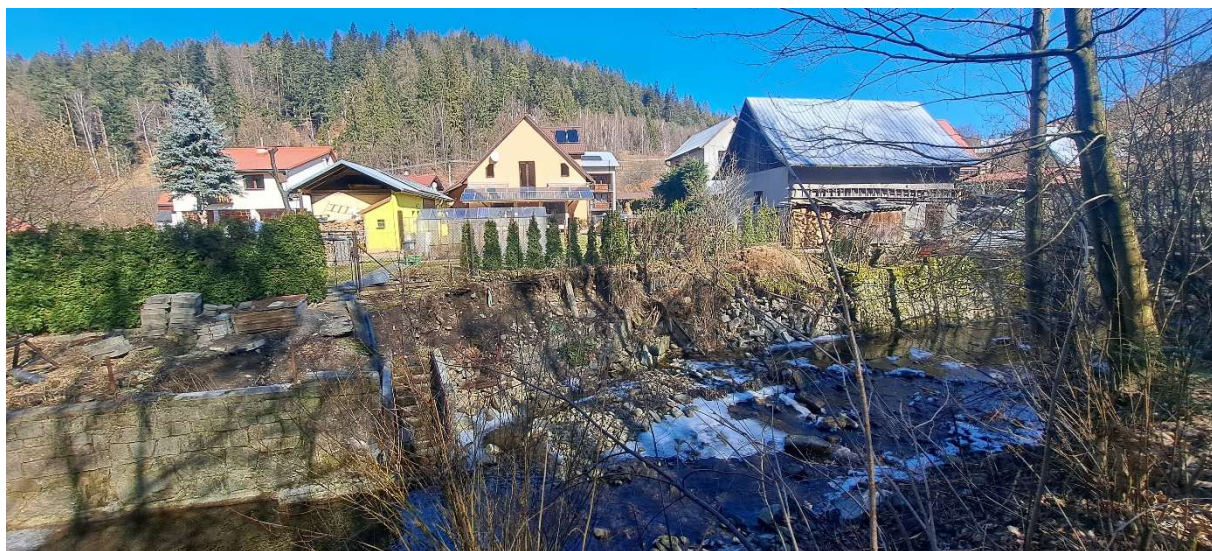
8. SO 02.2 – nátrž na pravém břehu