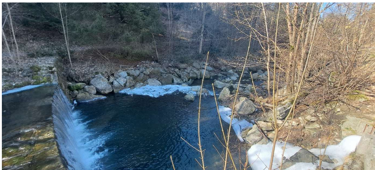
5. SO 02.1 – prostor vývaru stupně