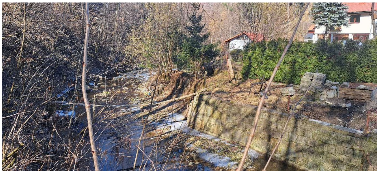
9. SO 02.2 – odstraňovaná zeď na pravém břehu